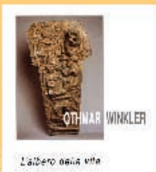
"L'albero della vita Der Lebensbaum" Sculpture e grafici di OTHMAR WINKLER

MOSTRE TEMPORANEE FINO AL 2 NOVEMBRE 2004