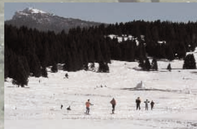
Centro Fondo Millegrobbe - Skilanglaufzentrum Millegrobbe

Biblioteca di Luserna, piazza Marconi, 2 tel. 0464 789646 • e-mail: luserna@biblio.infotn.it