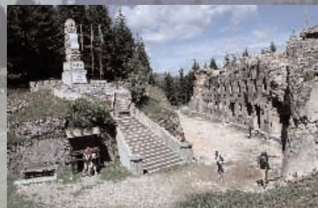
Forte Luserna - Werk Luserna

Per informazioni: cell. 333 2792492 tel. 0464 789714