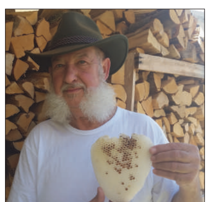
A.G. Dar màmnn von paing... gest inaran bötta... dar Nèllo von Postildjü

vrost von bintar. Nidar in Bisele iz sichar a khaltar platz, sèmm boda auvarraibet un ziaget a söttadar gevroratar air vodar Tuvar, un ditza hatten nèt gepróft zo traga auz in bintar. Un asó verte 'z geèzza, soinsa gestant augeholt, ummana ágehenk dar ändar in di drai favi sèmm gedorr. Arme vichela, pensàrn ke ka lángez soinsa gest partürt asó gerècht. Schauge du 'z vich hatt nèt geböllt khearn zuar in lânt. Eppaz kurdjósat? Bia nà di paing machan di khlöstarla pitt sèks saitn? Zo macha meara khlöstarla nützante daz mindarste zèra.