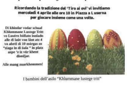
Ricordando la tradizione del "Tiro ai uovi" vi invitiamo mercoledì 4 aprile alle ore 10 in Piazza a Luserna per giocare insieme come una volta.